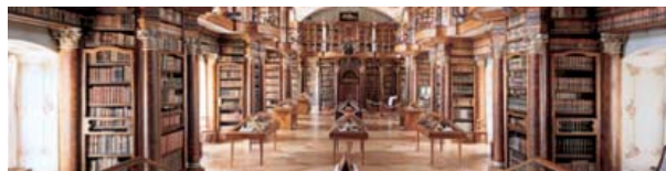
Verbesserung und Stabilisierung des Raumklimas der Stiftsbibliothek St. Gallen mit Hilfe intelligenter Raumlüftung