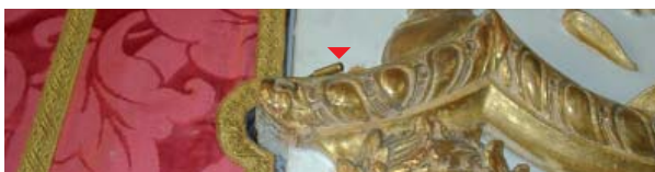
Mikrosensor im Goldrahmen des Spiegels integriert