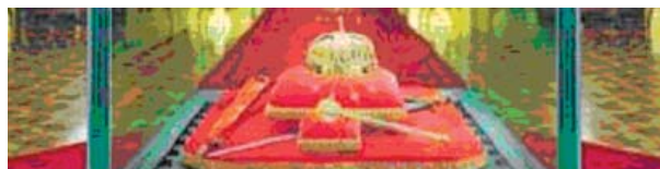
Ungarische Kaiserkrone im Thronsaal des Parlaments zu Budapest