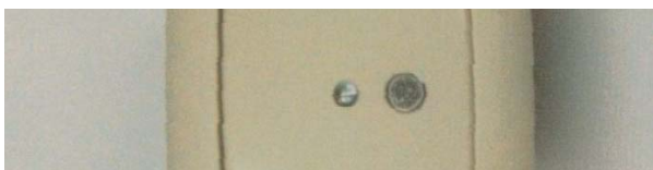
Sonderbau von Kombisensoren, in den Schalterelementen integriert