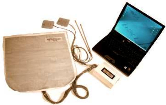
Abb.1: Einfaches THG3-System mit quadratischer Messfläche

Die Messwerterfassung erfolgt über mehrere, gleichmäßig über die gesamte Messfläche verteilte Sub-Miniatur-Kombisensoren. Diese volldigitalen Messstellen übermitteln in regelmäßigen Zeitabständen aktuelle Klimadaten an eine angeschlossene Prozessoreinheit, die alle Klimadaten in einer Messwerttabelle zusammenfasst und bei Bedarf an einen angeschlossenen PC weitergibt.